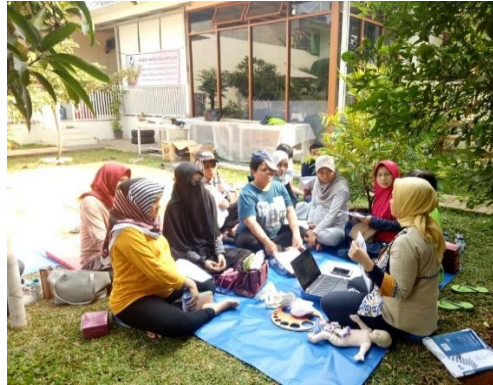
Gambar 2. Sesi praktek outdoor