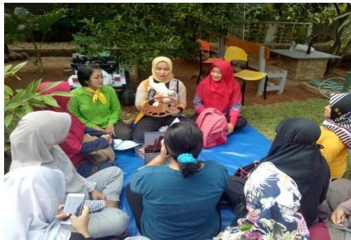
Gambar 3. Sesi praktek outdoor