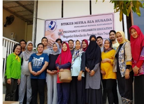
Gambar 8. Foto bersama