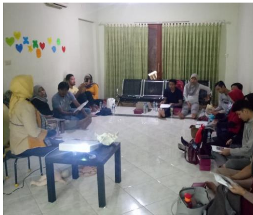
Gambar 5. Sesi presentasi indoor