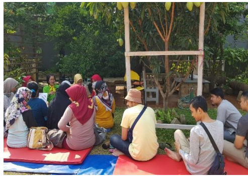
Gambar 4. Sesi praktek outdoor