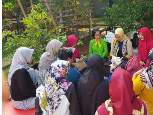
Gambar 1. Sesi praktek outdoor

bagaimana proses persalinan dan memberikan gambaran kepada suami apa yang harus dilakukan dalam mendukung ibu bersalin. Edukasi pada ibu hamil dapat mempengaruhi cara persalinan (Afshar et al., 2017). Ibu yang mendapatkan dukungan pada masa persalinan akan berpeluang untuk bisa melahirkan normal lebih tinggi dan minimal intervensi. (Hodnett et al., 2014).