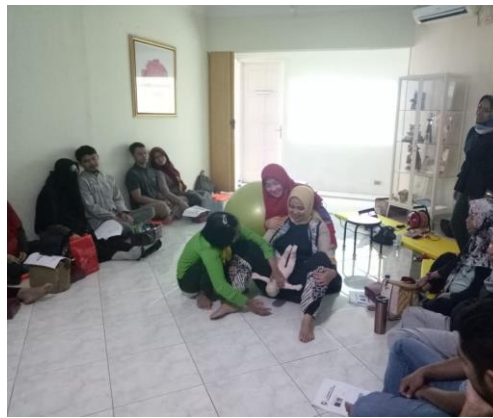
Gambar 6. Sesi praktek indoor