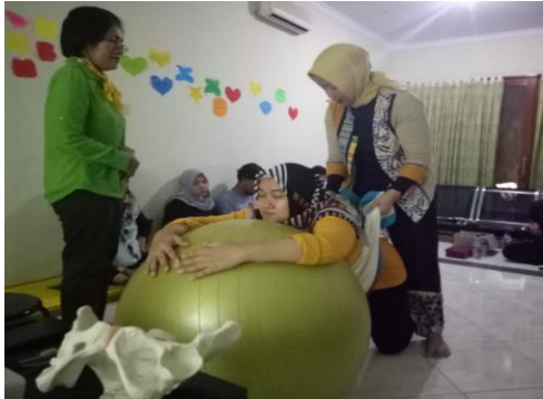
Gambar 7. Sesi praktek indoor