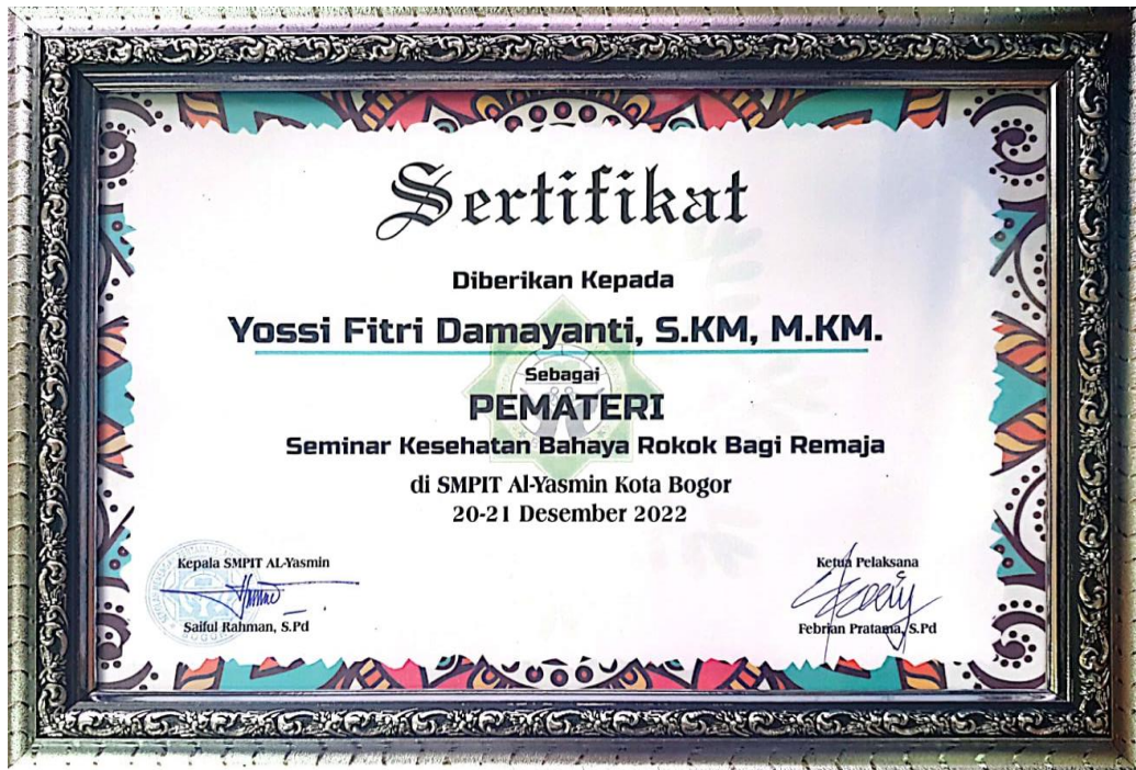
Lampiran 5. Sertifikat PkM